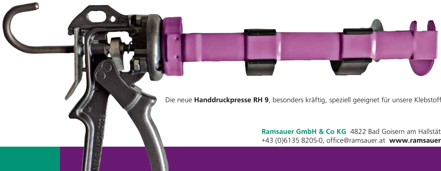
Die neue Handdruckpresse RH 9 , besonders kräftig, speziell geeignet für unsere Klebstoffe

640 DICHT KLEBER Geeignet zum Kleben und Abdichten. Neutraler Kraftkleber mit hoher Anfangsklebkraft und schneller Aushärtung. Absolut witterungsbeständig, frei von Silicon, Isocyanaten und Lösungsmittel, haftet auf feuchtem Untergrund. Besonders geeignet für die Verklebung von Spiegeln. Geeignet für den Einsatz in Reinräumen. Geprüft für einbruchhemmende WK2-Verklebungen. Geprüft auf EMICODE EC 1 - R „sehr emissionsarm“